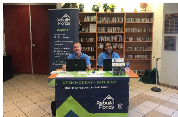
Figura 2: Evento de presentación de alcance comunitario biblioteca de la sucursal del noroeste (Periodo de registro inicial)