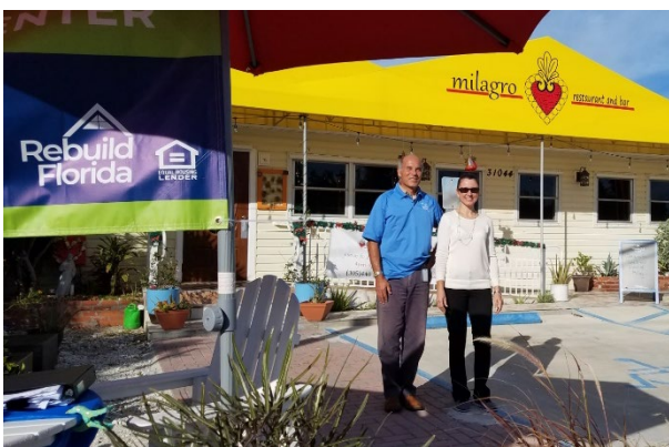
Figura 1: Evento de alcance comunitario en el restaurante Milagro (Periodo de registro inicial)

A través de asociaciones público-privadas y la coordinación con organizaciones locales, Rebuild Florida facilitó más de 100 eventos de divulgación pública en las comunidades más afectadas durante las fases iniciales de registro y solicitud.