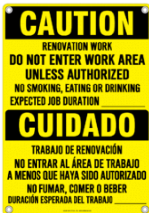
Ejemplo de señalización