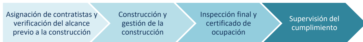
Figura 2: Construcción y cumplimiento

La fase de construcción y cumplimiento, como se observa en la Figura 2, es donde se brinda asistencia de reparación, reemplazo o reconstrucción al propietario a través de las actividades de construcción directas realizadas por el programa, y el resultado es una unidad de vivienda rehabilitada. Después de las actividades de construcción y la finalización de cualquier período de cumplimiento, la subvención se cerrará.