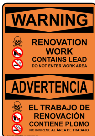
Ejemplo de señalización

En el caso de que las condiciones del sitio no se ajusten a las normas, se emitirá una orden de detención de trabajo hasta que el personal del programa resuelva y verifique todas las cuestiones. En el cálculo de la duración de la construcción se tendrá en cuenta el tiempo de espera del proyecto y se considerará un fallo del contratista. La orden de suspensión de trabajo también se considerará cuando se determinen futuras asignaciones y participación en futuros proyectos.