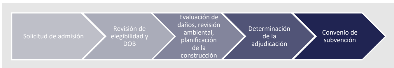
FIGURA 1: PASOS DE LA SOLICITUD INICIAL Y LA DOCUMENTACIÓN

Los requisitos federales para la prestación de asistencia a la construcción en el marco del HRRP son complejos y requerirán un proceso de varios pasos (véanse las figuras 1 y 2 a continuación) para garantizar el cumplimiento de todas las normativas y requisitos vinculados a la fuente de financiación. Con la ayuda del personal y de los proveedores, el estado trabajará con un grupo de contratistas calificados y contratados que serán asignados por el programa para reparar, reconstruir o reemplazar las propiedades dañadas. Los propietarios de viviendas de alquiler completarán las solicitudes y presentarán la documentación de elegibilidad que se requiere para avanzar a una adjudicación de beneficios a los propietarios de viviendas de alquiler elegibles. Después de la revisión de la elegibilidad y la duplicación de beneficios (DOB), el resultado de la fase inicial de documentación de elegibilidad es el avance a la fase de evaluación, donde el personal del programa llevará a cabo una evaluación de los daños, la revisión ambiental, y desarrollar el alcance del trabajo (SOW) para las reparaciones necesarias (o la reconstrucción o sustitución). El SOW se utiliza entonces para desarrollar la Determinación de Adjudicación - por ejemplo, el tipo de actividad de reparación disponible para el propietario de la vivienda de alquiler, que es seguido por la firma de un acuerdo de préstamo.