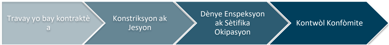
Imaj 2: Konstriksyon ak Konfòmite

Faz konstriksyon ak konfòmite a, jan ou wè nan Imaj 2 a, se kote yo bay mèt pwopriyete a asistans lan pou reparasyon, ranplasman oswa rekonstriksyon an pa mwayen aktivite konstriksyon dirèk pwogram lan fè yo epi rezilta se yon inite lojman amenaje. Apre yo fin fè dènye aktivite konstriksyon yo ak finisman nenpòt peryòd konfòmite, y ap fèmen sibvansyon an.