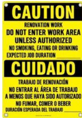
EJEMPLO DE SEÑALIZACIÓN