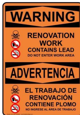
Ejemplo de señalización

Si las condiciones de la obra no son conformes, se emitirá una orden de paralización de las obras hasta que se resuelvan todos los problemas y sean verificados por el personal del programa. El tiempo en que el proyecto esté detenido se incluirá en el cálculo de la duración de la construcción y se considerará culpa del contratista y estará sujeto a penalizaciones por rendimiento. La emisión de una orden de paralización de las obras también se tendrá en cuenta a la hora de determinar las futuras asignaciones y la participación en futuros proyectos.