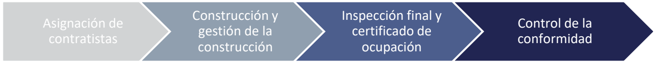
FIGURA 2: CONSTRUCCION Y CUMPLIMIENTO

actividades de construcción y el período de cumplimiento, la subvención se cerrará, lo que significa que se completará toda la documentación requerida para el cumplimiento y el mantenimiento de registros del HUD.