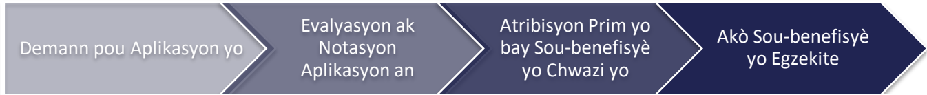
Imaj 2: Pwosesis Reyalizasyon – Prestasyon Sèvis ak Konfòmite