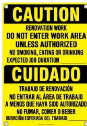
SEÑALIZACIÓN DE EJEMPLO