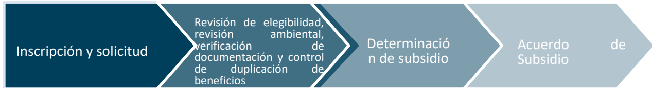
Figura 1: Pasos de solicitud y documentación iniciales

La fase de construcción y cumplimiento, como se muestra en la Figura 2, es cuando se provee la asistencia para reparar, reemplazar o reconstruir al dueño del inmueble arrendador a través de actividades directas de construcción realizadas por el programa y el resultado es una unidad de vivienda accesible y lista para el mercado. Después de la verificación de los ingresos del inquilino y la finalización del periodo de accesibilidad económica para unidades en alquiler unifamiliares, que es un mínimo de un año, el subsidio cerrará suponiendo que el dueño del inmueble ha mantenido el cumplimiento a lo largo del término del periodo de accesibilidad económica.