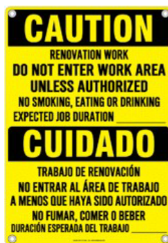
Egzanp Afich yo