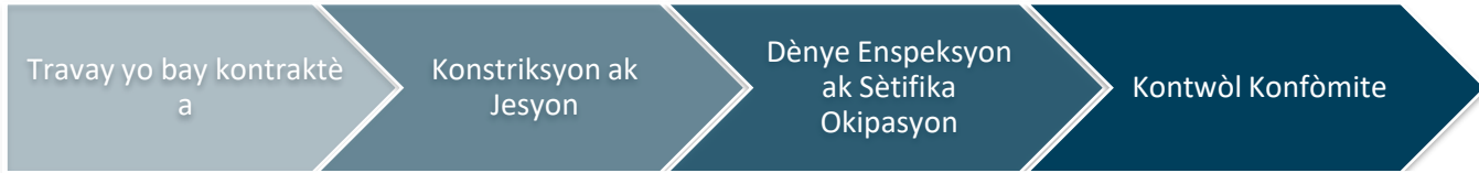
Imaj 2: Konstriksyon ak Konfòmite

Faz konstriksyon ak konfòmite a, jan ou wè nan Imaj 2 a, se kote yo bay mèt pwopriyete a asistans lan pou reparasyon, ranplasman oswa rekonstriksyon an pa mwayen aktivite konstriksyon dirèk pwogram lan fè yo epi rezilta se yon inite lojman amenaje. Apre yo fin fè dènve aktivite konstriksyon yo ak finisman nenpòt peryòd konfòmite, y ap fèmen sibvansyon an.