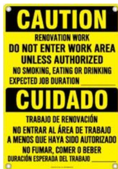
Egzanp Afich yo