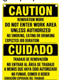
SEÑALIZACIÓN DE EJEMPLO