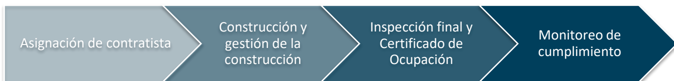
FIGURA 2: CONSTRUCCIÓN Y CUMPLIMIENTO

La fase de construcción y cumplimiento, como se muestra en la Figura 2, es cuando se provee la asistencia para reparar, reemplazar o reconstruir al propietario del inmueble a través de actividades directas de construcción realizadas por el programa y el resultado es una unidad de vivienda rehabilitada. Después de las actividades de construcción finales y la completación de cualquier periodo de cumplimiento, se cerrará el subsidio.