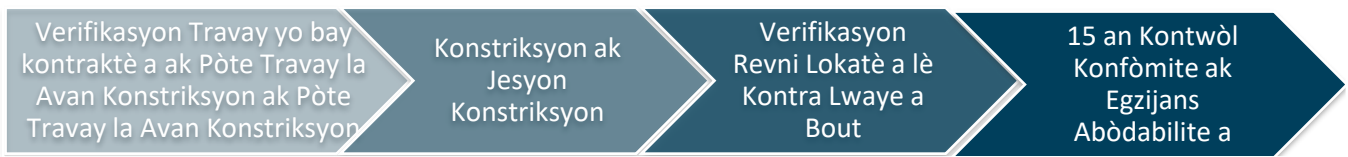
Imaj 3: Konstriksyon ak Konfòmite pou Kay Miltifamilyal

Pwojè amenajman oswa rekonstriksyon kay miltifamilyal alwaye ki gen senk inite oswa plis yo pral egzije pou yo rete abòdab pandan 15 zan ominimòm, jan imaj 3 montre a: