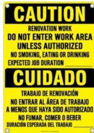
Egzanp Afich yo