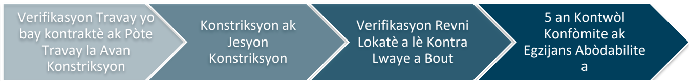
Imaj 2: Konstriksyon ak Konfòmite

Pwojè amenajman oswa rekonstriksyon kay miltifamilyal alwaye ki gen senk inite oswa plis yo pral egzije pou yo rete abòdab pandan 15 zan ominimòm, jan imaj 3 montre a: