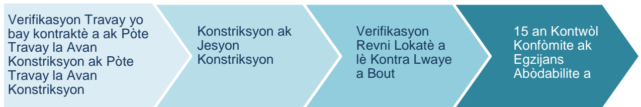
Imaj 3: Konstriksyon ak Konfòmite pou Kay Miltifamilyal

Pwojè amenajman oswa rekonstriksyon kay miltifamilyal alwaye ki gen senk inite oswa plis yo pral egzije pou yo rete abòdab pandan 15 zan ominimòm, jan imaj 3 montre a: