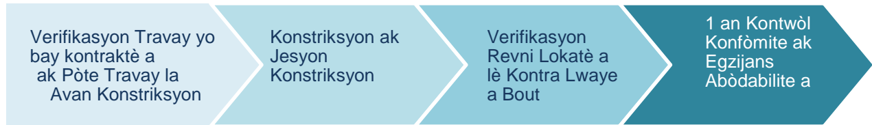
Imaj 2: Konstriksyon ak Konfòmite

Pwojè amenajman oswa rekonstriksyon kay miltifamilyal alwaye ki gen senk inite oswa plis yo pral egzije pou yo rete abòdab pandan 15 zan ominimòm, jan imaj 3 montre a: