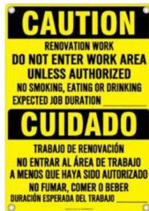
Egzanp Afich yo